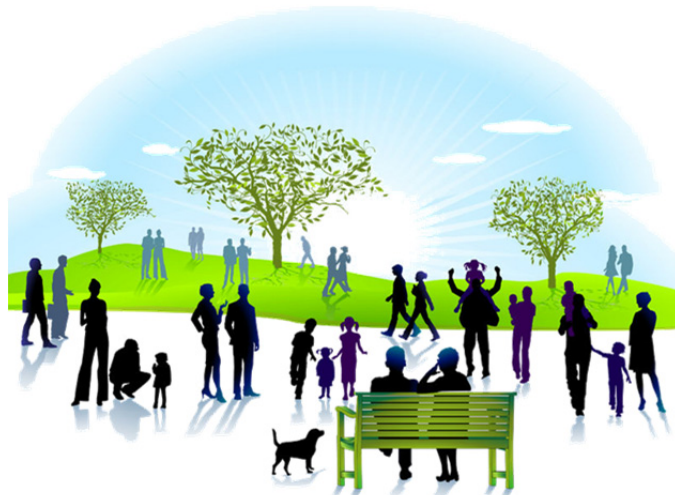
Calidad de vida