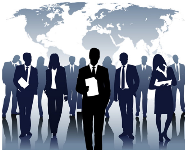
Mercado de trabajo