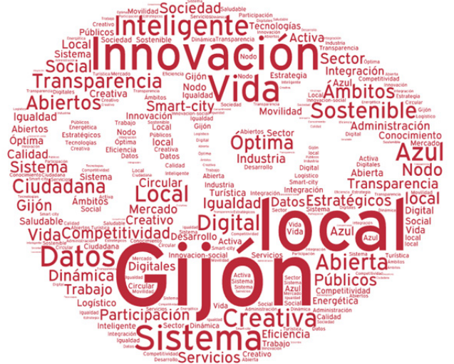
Sistema local de innovación